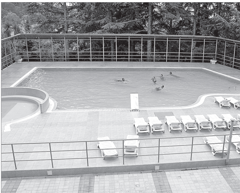
...А летний бассейн откроется в мае

ратура в феврале у нас +14, вечная зелень, чистый воздух... В пансионате есть прекрасный 30-метровый зимний бассейн, который, кстати, так нравится москвичам. Смена обстановки, комфортные условия проживания — всё это скажется благотворно на вашем здоровье и настроении.